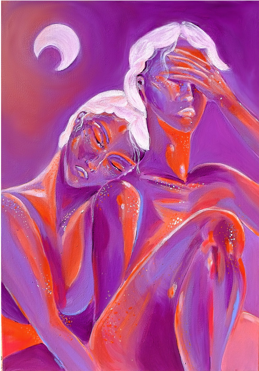
Amoureuses - acrylique 50x70cm