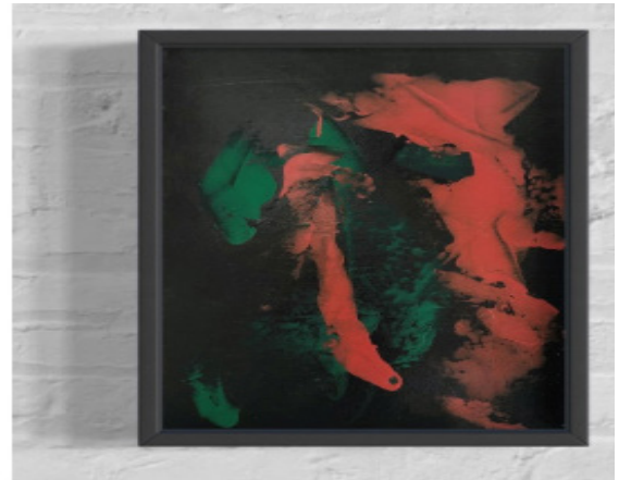
Série «En osmose» Acrylique au couteau sur toile 30 x 40 cm année 2022