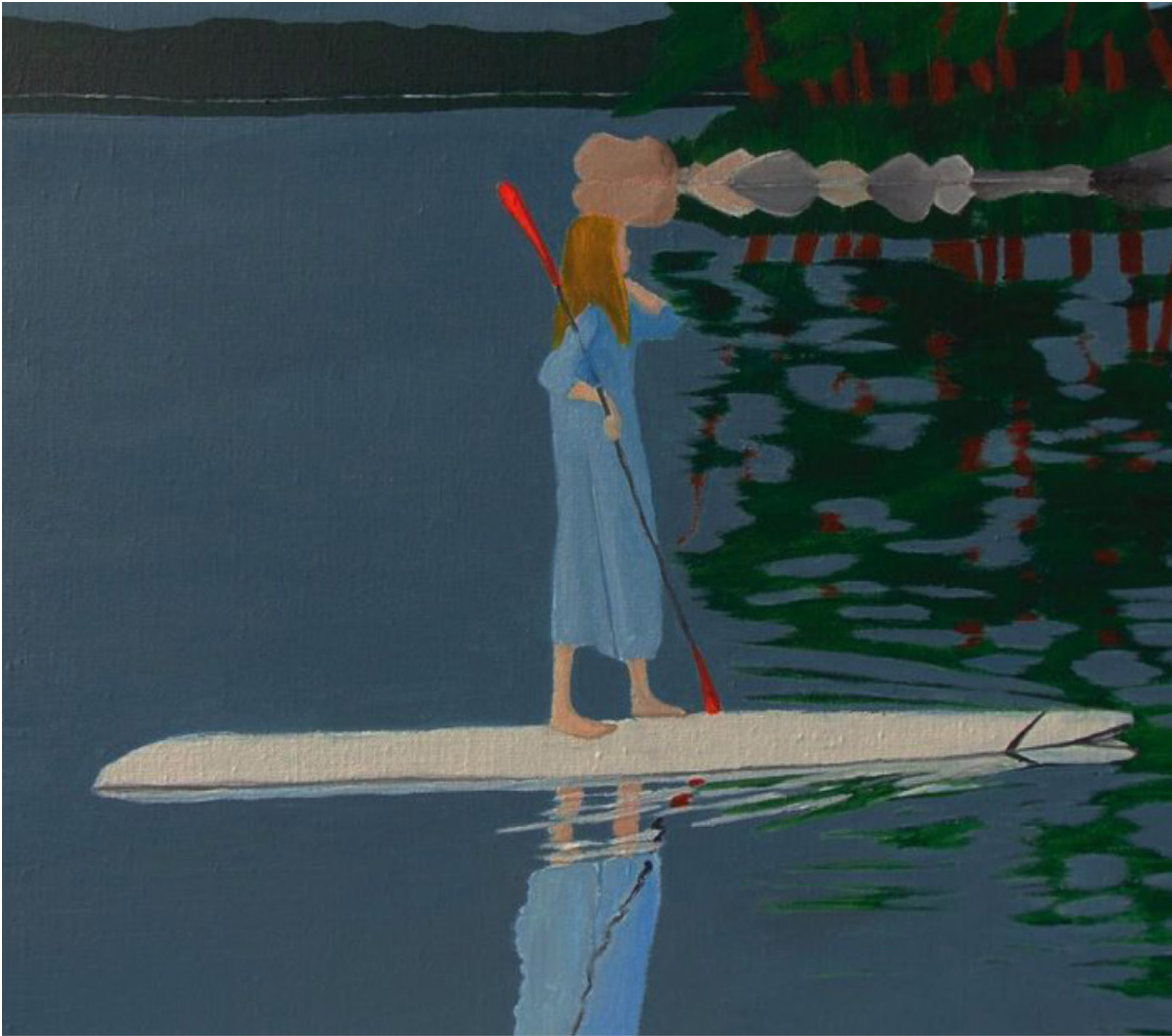
Agneta 61 x 51 cm, Acrylique sur toile, 2021