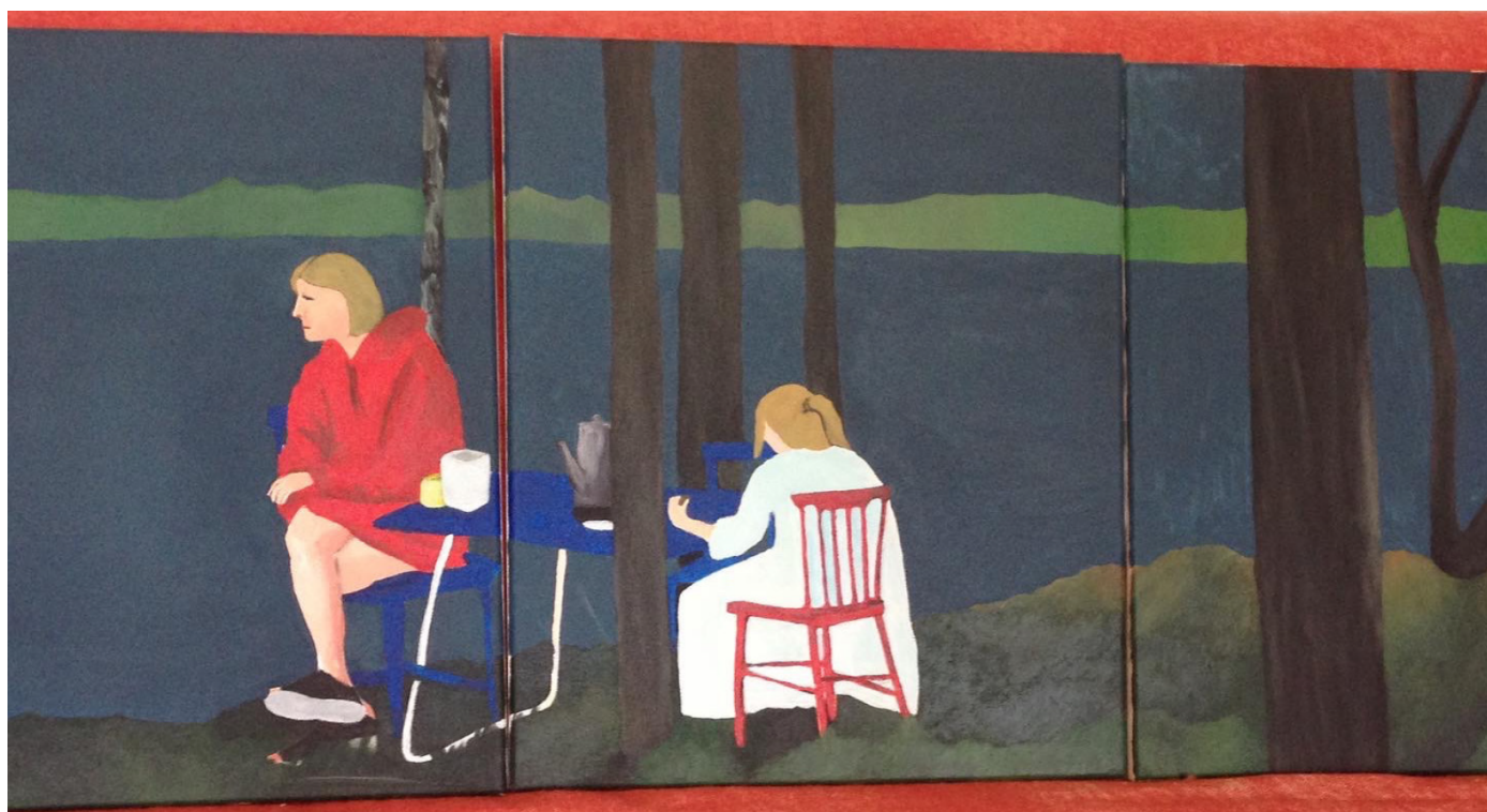
La conversation triptyque 40 x 30 cm, Acrylique sur toile, 2021