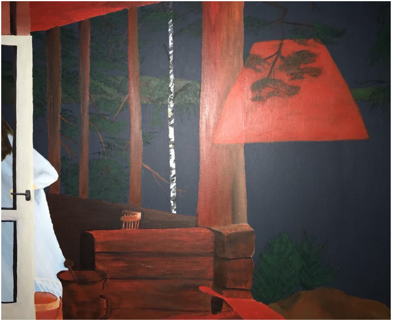
La fuite 73 x 60 cm.