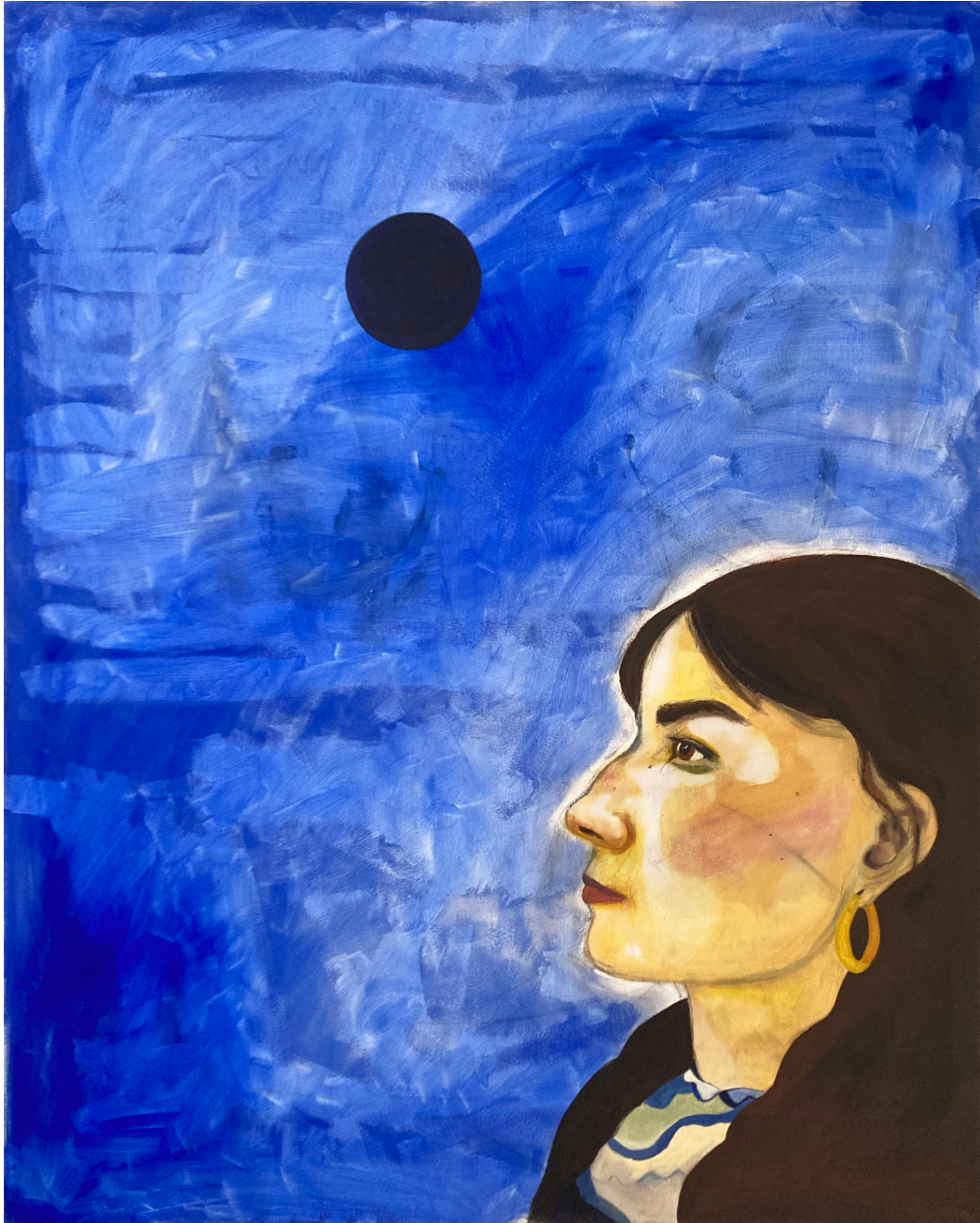
Unconditional 100 x 80 cm mixed media sur toile