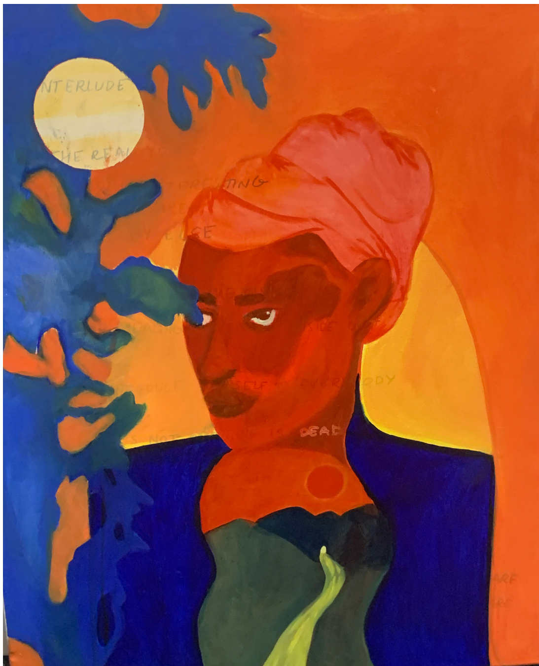
Interlude 5 mixed media sur toile de coton 50 x 60 cm