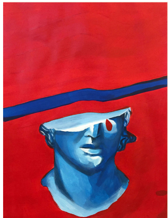
Portraits 21 x29,7 cm acrylique sur papier d'art