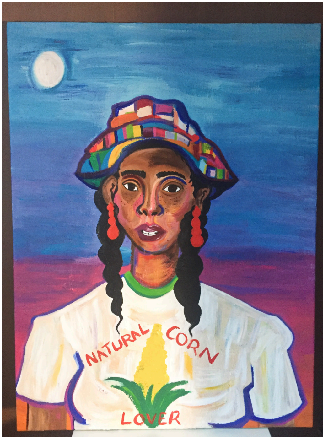
NATURAL CORN LOVER Acrylique sur toile 60 x 80 cm 2023