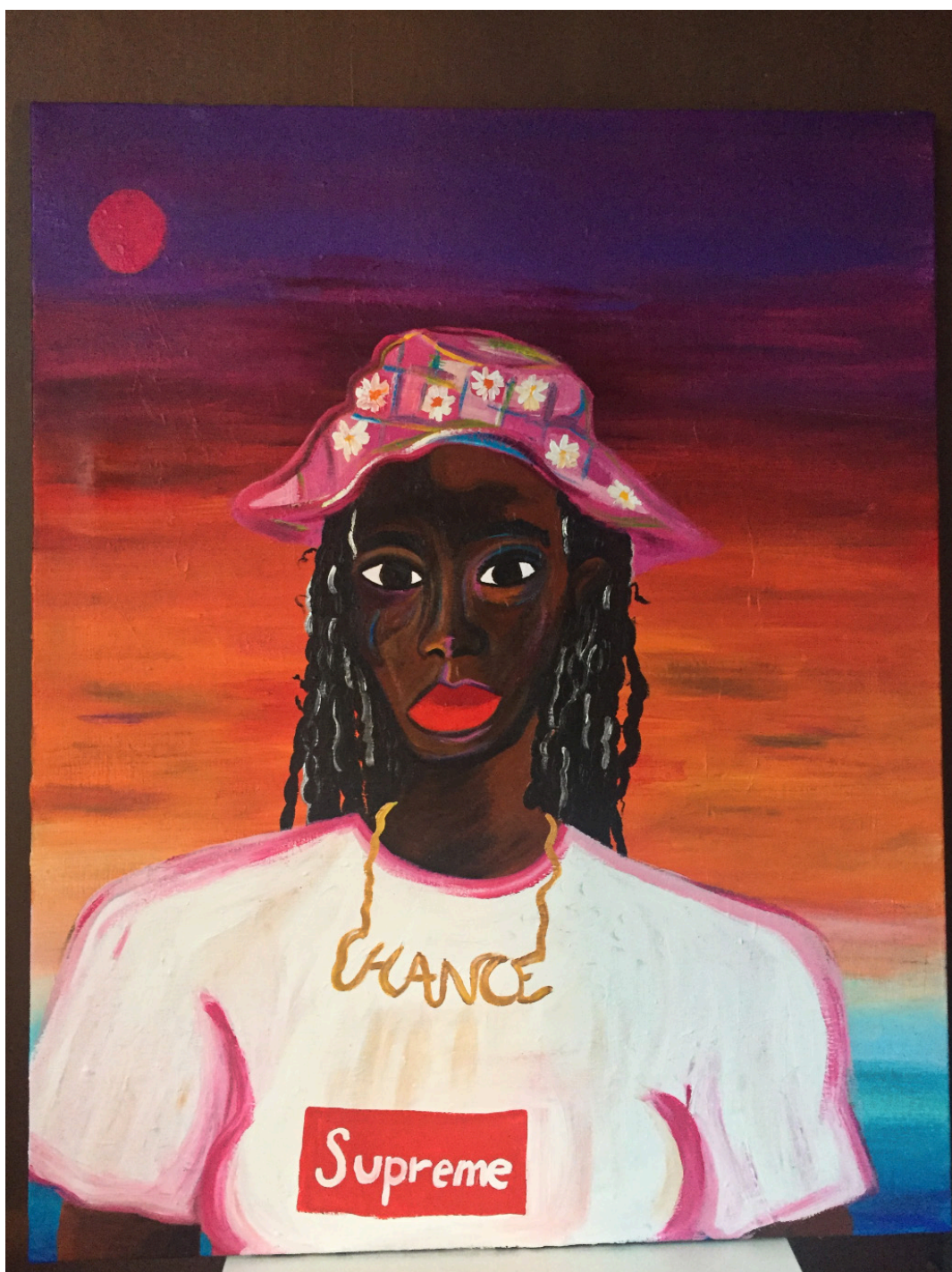
CHANCE SUPREME Acrylique sur toile 60 x 80 cm 2023