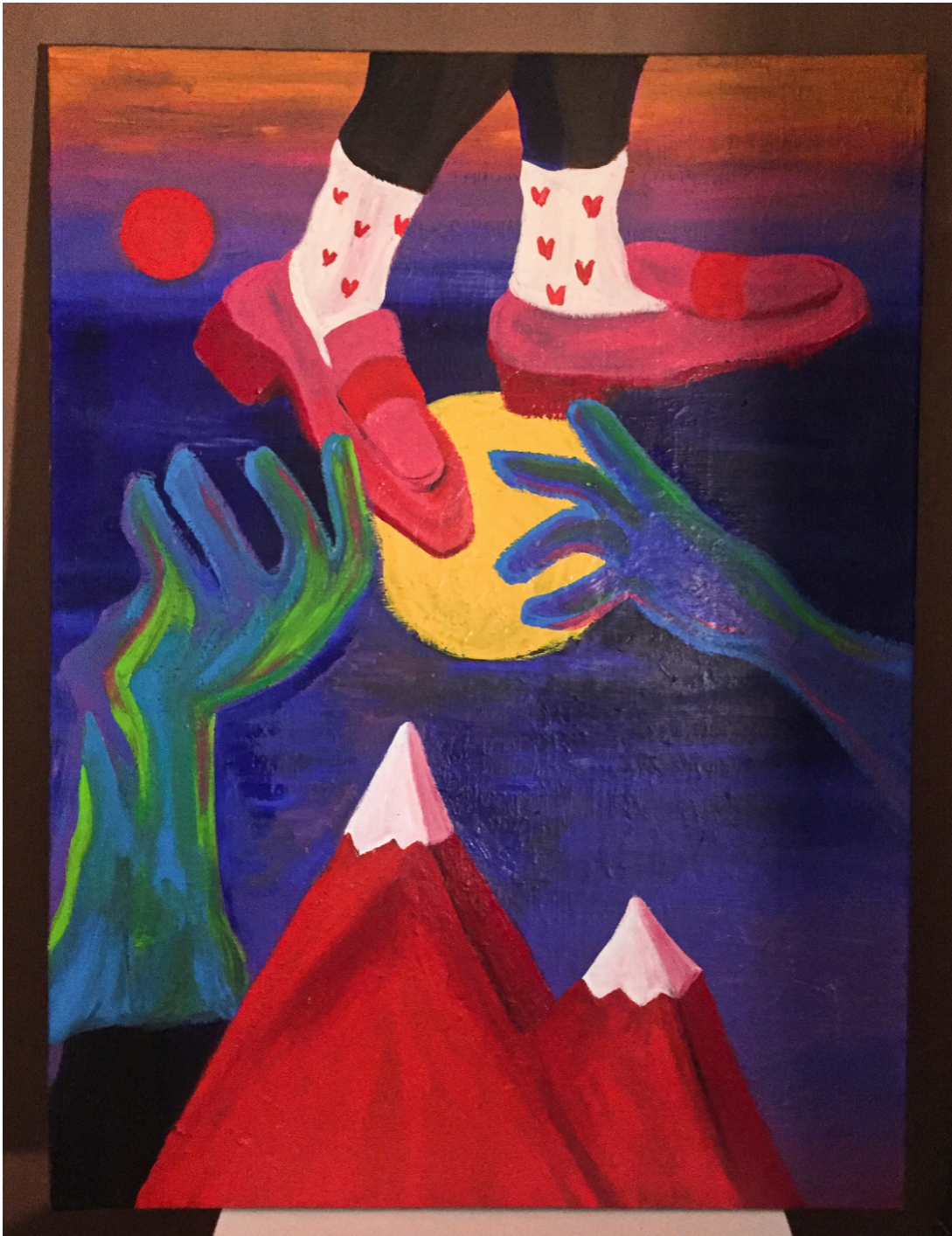
SUSPENSION LUNAIRE Acrylique sur toile 60 x 80 cm 2023