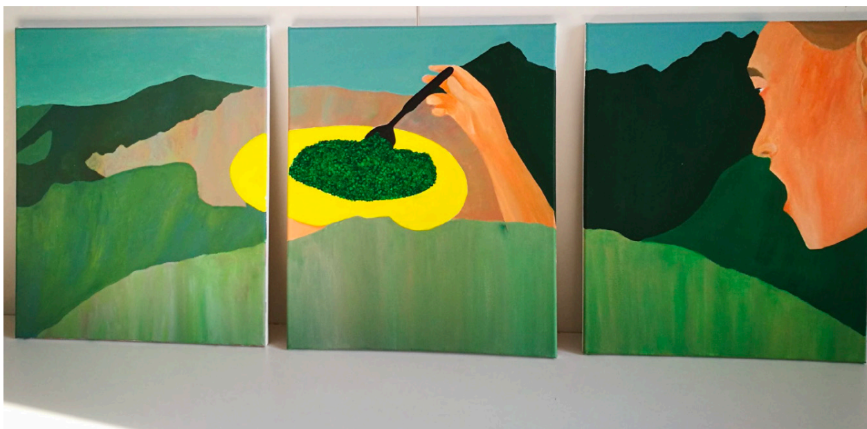
Crapagoûter triptyque 46 x 38 cm, Acrylique sur toile, 2022