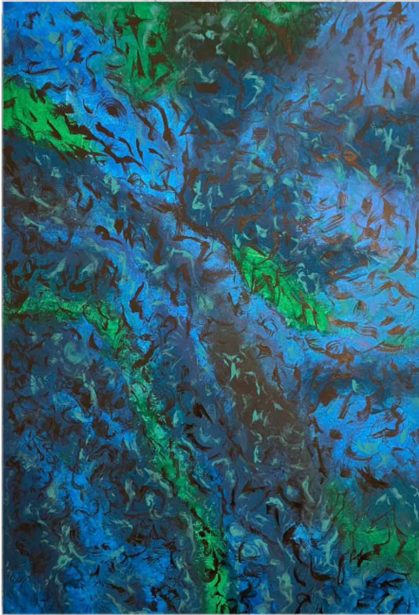
Magnétisme Acrylique au couteau sur toile 90 x 70 cm année 2022